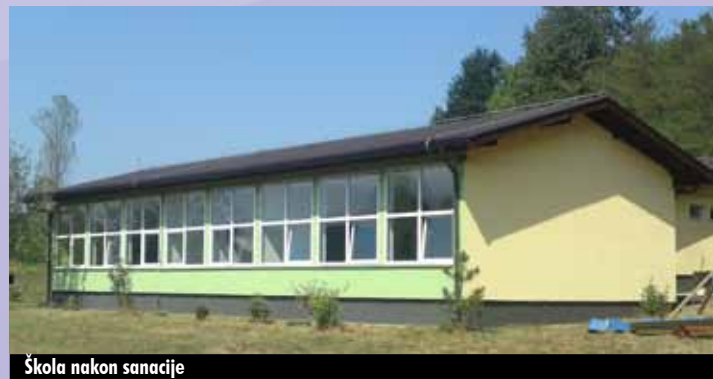
Škola nakon sanacije

REZ Agencija je izgradila odličnu saradnju sa donatorskim organizacijama iz Holandije sa kojima je implementirala već 24 projekata širom regije Centralna BiH. Uspostavljena je odlična