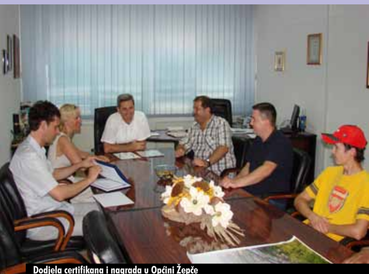
Dodjela certifikata i nagrada u Općini Žepče

Projekt je finansiran od strane Norveške Ambasade u BiH, a implementira ga REZ Agencija u partnerstvu sa općinama Busovača, Maglaj, Novi Travnik, Travnik i Žepče.