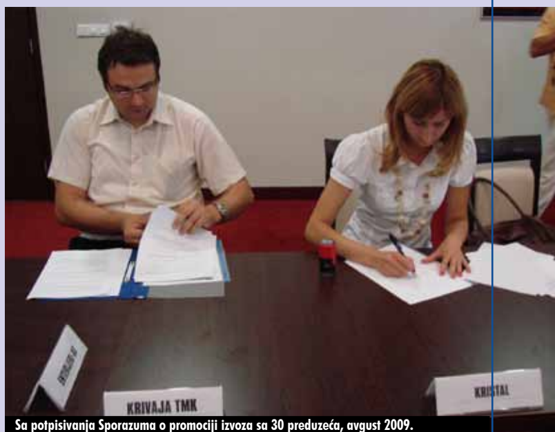
Sa potpisivanja Sporazuma o promociji izvoza sa 30 preduzeća, avgust 2009.

Na kraju, važno je istaći da je službeni završetak SET