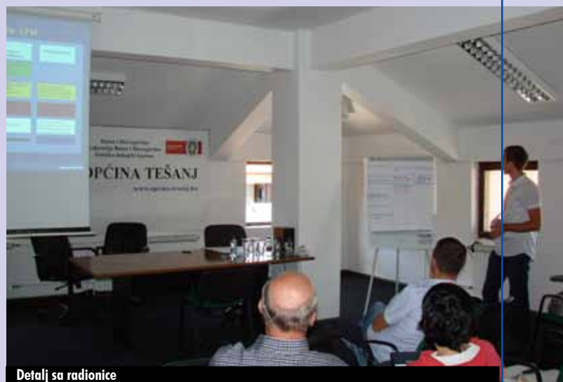
Detalj sa radionice

Na prijedlog općine Tešanj predstavnici REZ Agencije su održali četvorodnevni seminar iz oblasti upravljanja projektnim ciklusom za općinske uposlenike. Polaznici obuke su upoznati sa općim principima i EU metodologijom upravljanja projektnim ciklusom (PCM), a posebna pažnja je bila posvećena ulozi menadžera projekta u vođenju i realizaciji projekata, te značaju internog monitoringa za njihovu uspješnu realizaciju. Na konkretnom primjeru projekta uspostavljanja poslovne zone, kao jednog od projekata koji imaju strateški značaj za općinu, urađena je Logička matrica za projekt uspostavljanja poslovne zone. Logička matrica/Logički okvir je polazni dokument za izradu projekata i predstavlja šematski prikaz projekta u standardiziranom formatu, a jedan je od obaveznih dokumenata u projektnim aplikacijama EU i drugih donatora. Edukaciji, koja je održana u periodu od 28. septembra do 06. oktobra 2011. godine, prisustvovalo je 14 uposlenika općine Tešanj.