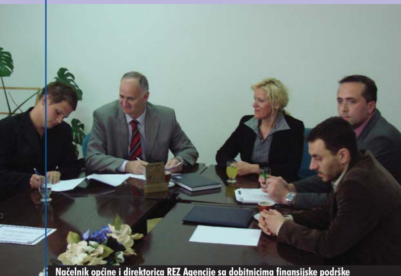
Načelnik općine i direktorica REZ Agencije sa dobitnicima finansijske podrške