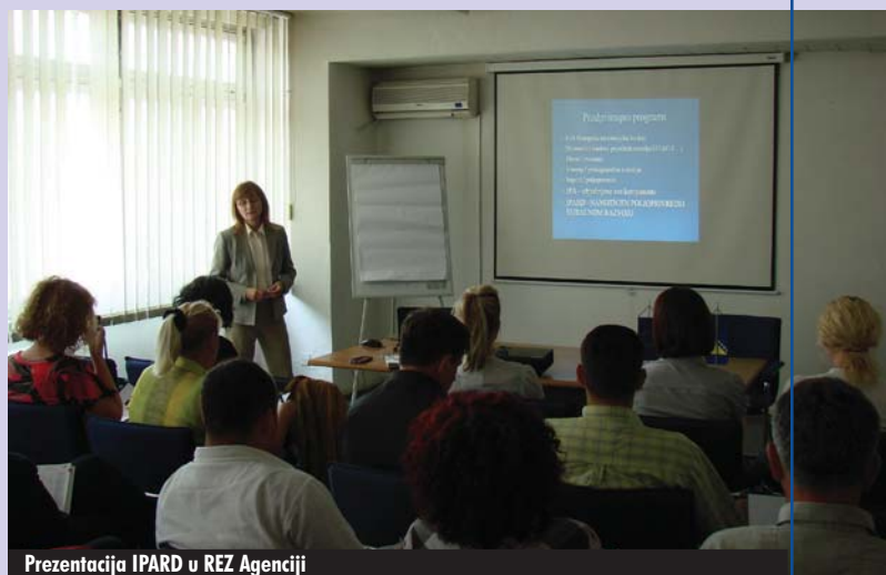
Prezentacija IPARD u REZ Agenciji

Ovoj prezentaciji, koja je održana 01. juna 2011. godine u prostorijama REZ Agencije, prisustvovali su predstavnici općina, lokalnih razvojnih agencija, poljoprivrednih zadruga i preduzeća iz regije Centralna BiH, kao i predstavnici Sarajevske regionalne razvojne