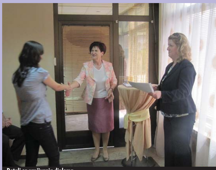
Detalj sa uručivanja diploma

Ceremoniji dodjele diploma, pored polaznika, prisustvovali su predstavnici REZ Agencije, FIRMA projekta i konsultantske kuće BHM.