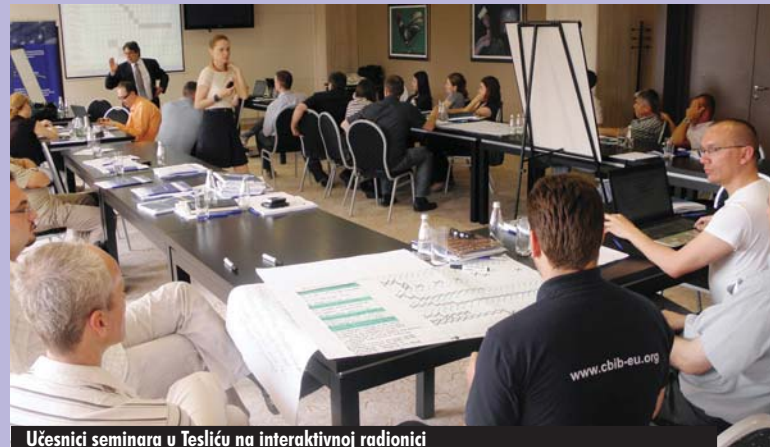
Učesnici seminara u Tesliću na interaktivnoj radionici

Treći po redu, ciklus seminara u okviru projekta Podrška Evropske unije institucionalnom jačanju kapaciteta za regionalni i lokalni razvoj i razvoj malih i srednjih preduzeća (EURELSMED) za općine iz regije Centralna BiH održan je u Tesliću u periodu od 30. maja do 02. juna 2011. Tema seminara je bila Upravljanje projektnim ciklusom i pristup logičke matrice za identifikaciju i razvoj projekata u kontekstu trenutnih/budućih programa finansiranja. Ovaj četvorodnevni program obuke je bio fokusiran na identifikaciju problema i analizu ciljeva, identifikaciju projekata, izradu logičke matrice i projektne aplikacije, uključujući akcioni plan i budžet, te implementaciju projekta. Obuka je izvedena putem interaktivnih radionica i vođenog rada u grupama, čime se nastojala razviti kompetentnost i unaprijediti praktično znanje učesnika kako bi mogli voditi cijeli proces, od postavljanja projekne ideje do razvijenog prijedloga projekta. Seminar, na kojem su učestvovali predstavnici općina Tešanj, Doboj Jug, Teslić i Usora, predstavnici Ministarstva za privredu i Ministarstva za poljoprivredu,