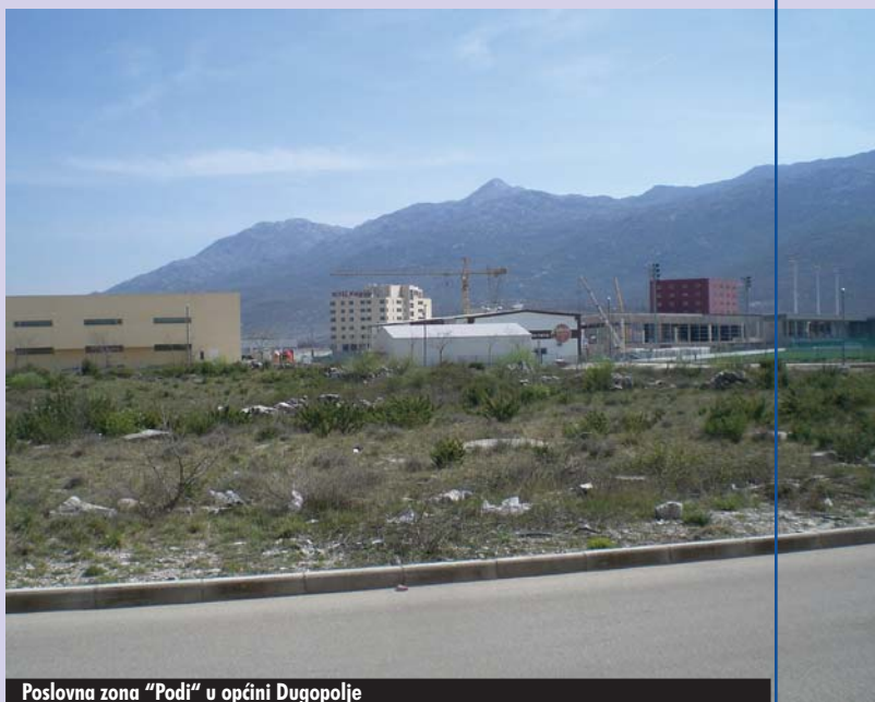
Poslovna zona „Podi“ u općini Dugopolje

Nakon prezentacije je upriličen obilazak poslovne zone i posjeta tvornici za preradu ribe „Ostrea“ koja