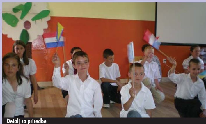
Detalj sa priredbe

Veterani su od 23.-27.maja 2011.godine boravili u područnoj školi u Mečevićima u Zavidovićima gdje su izvodili slijedeće radove: farbanje fasade, krečenje i farbanje svih prostorija u školi, popravku i farbanje drvene stolarije, zamjena dotrajalih vrata na učionicama i zbornici, postavljanje laminata u učionicama, popravka i zamjena elektroinstalacija (šalteri, utičnice, rasvjeta-postavljenje su nove neonske sijalice), donirana je tehnička oprema (tv,