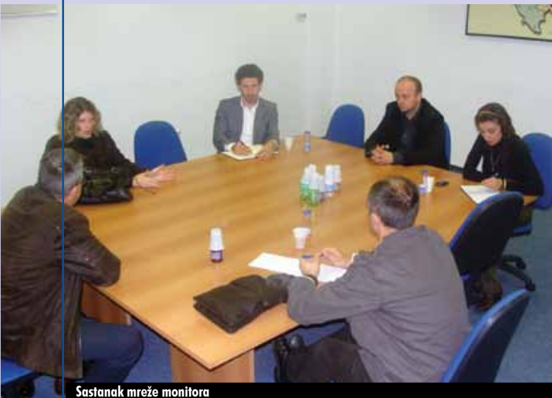
Sastanak mreže monitora

Sastanak je organizovan u cilju usaglašavanja detalja koje je neophodno uraditi kako bi Mreža mogla kvalitetno nastupati sa apliciranjem za angažmane u monitoringu projekata kod različitih donatora u Bosni i Hercegovini.