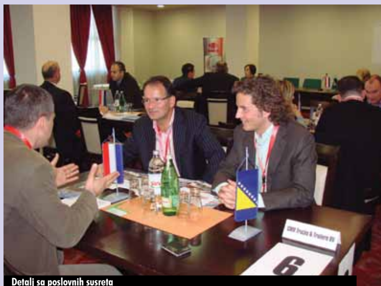
Detalji sa poslovnih susreta

Bilateralni poslovni susreti bosanskohercegovačkih i holandskih privrednika u organizaciji Regionalne razvojne agencije za regiju Centralnu BiH – REZ u partnerstvu sa Kraljevskom Asocijacijom metalaca - Royal Metaalunie iz Holandije održani su 04. i 05. novembra 2010. godine u Zenici. REZ Agencija je i prethodnih godina organizovala takve susrete, a ovogodišnji poslovni susreti su se održali uz podršku Ambasade Kraljevine Holandije u Sarajevu. Poslovni susreti su okupili preduzeća iz metaloprerađivačke, drvne, industrijske proizvodnje komponenti od brizgane plastike, intelektualne usluge inženjeringa i projektovanja, a raspored bilateralnih susreta je planiran unaprijed prema poslovnim profilima i izraženim interesima prijavljenih preduzeća. Učestvovalo je 12 holandskih i 57 domaćih preduzeća iz cijele Bosne i Hercegovine. Cilj susreta je upoznavanje holandskih preduzetnika sa potencijalima bosanskohercegovačkog tržišta.