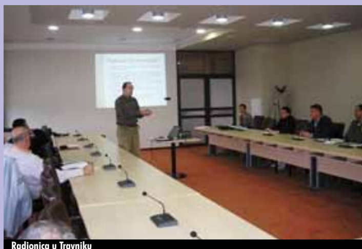
Radionica u Travniku