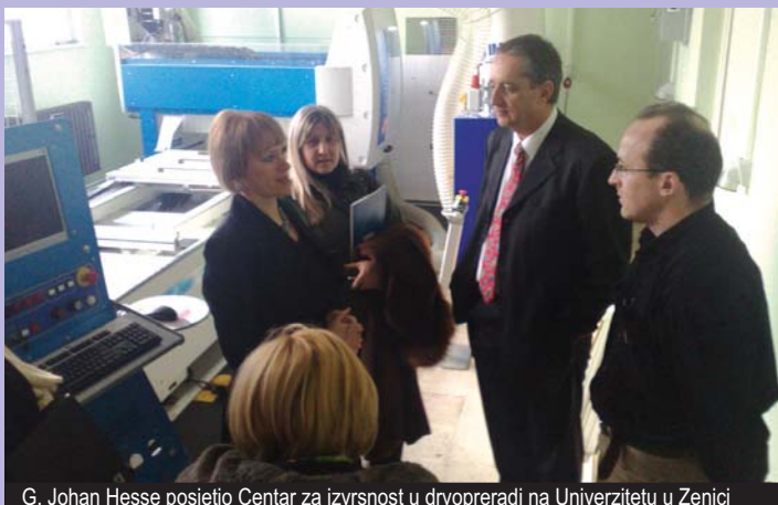
G. Johan Hesse posjetio Centar za izvrsnost u drvoprerađi na Univerzitetu u Zenici

Nakon sastanka u REZ Agenciji, upriličena je posjeta Centru za izvrsnost u drvoprerađi na Univerzitetu u Zenici i Proizvodnom inkubatoru Zenica, te budućem Tehnološkom parku Zenica. Kao gosti, predstavnici Delegacije Evropske komisije u BiH su učestvovali u radu Partnerske grupe za definiranje Strategije ekonomskog razvoja regije Centralna BiH.