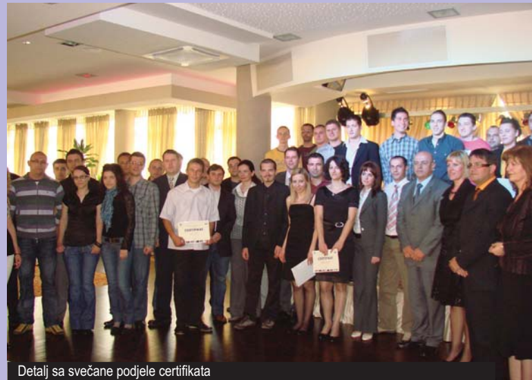
Detalj sa svečane podjele certifikata