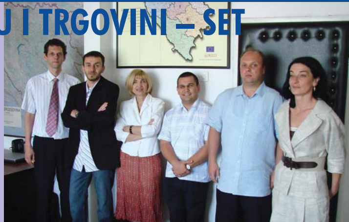
Članovi Tima za podršku malim i srednjim preduzećima

REZ ima namjeru da preuzme i veću ulogu u razvoju poduzetništva u regiji, što je nezamislivo bez poboljšanja poslovnog ambijenta. U regionalnom okviru to znači da će SET djelovati na poboljšanje konkurentnosti